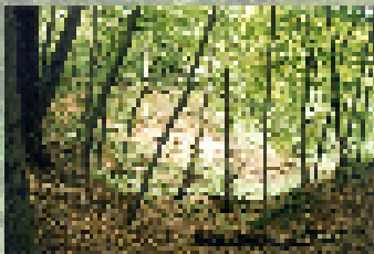
Steinkohlenbergbau bei Wefensleben